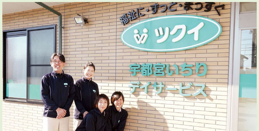
株式会社ツクイのスタッフの皆さん