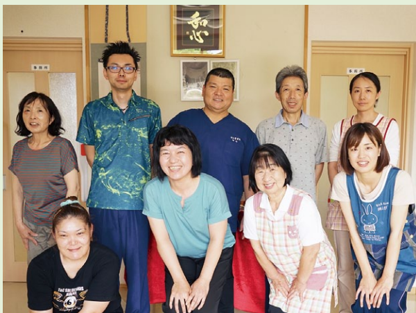
有限会社 増徳のスタッフの皆さん

正直に言うと、私たちのような小規模の組織が3つ星を取得できるとは思っていませんでした。その分とてもうれしく思っています。認証取得に取り組むことで、社内の人材育成についての精度をしっかりと構築できたことが大きな成果だと思っています。関連する他の制度についてもきちんと規約として文章化することで、見える化ができました。認証制度が発展するために、今後は業界内だけではなく、一般の方や、社会に浸透していくことを願っています。