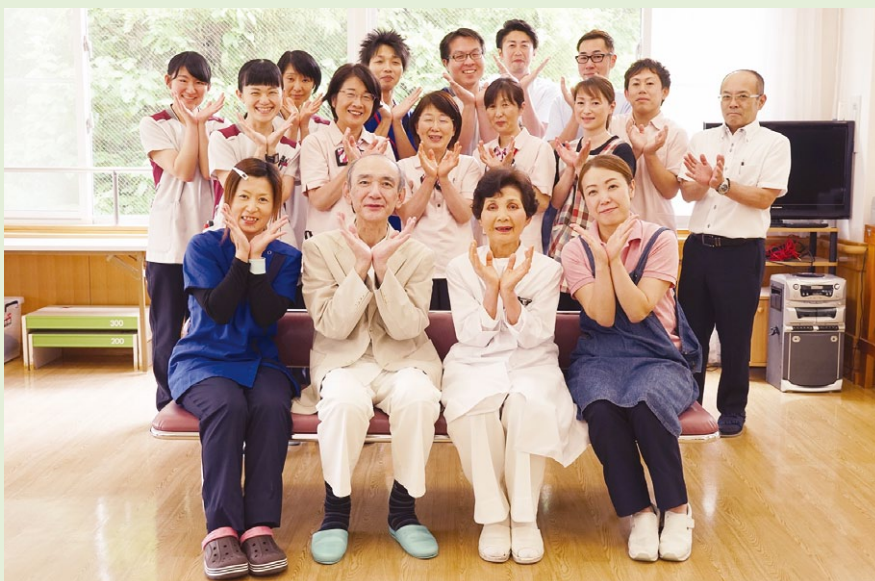
医療法人 矢尾板記念会のスタッフの皆さん

さらに人材育成、働きやすい環境づくりに力をいれ、介護を必要とする方々が安心して過ごせるよう努めてまいります。認証法人として、より高みを目指していきたいと思っております。