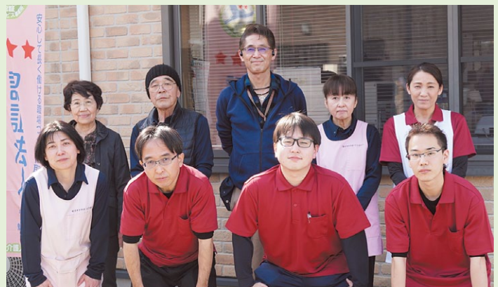
ケアサポートひまわりの皆さん