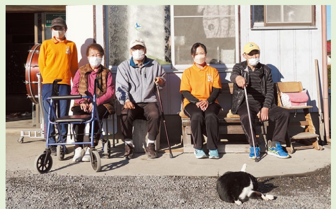
日向でくつろぐひととき