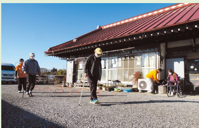
広いお庭で運動を

自分なりにスタッフの育成、業務遂行、家庭環境等を考慮して、働きやすい職場環境を構築したいと考えて行動していましたが、このような制度に照らし合わせる事で、不足していた点などが把握できて、自分が行ってきた内容を見直す事が出来ました。