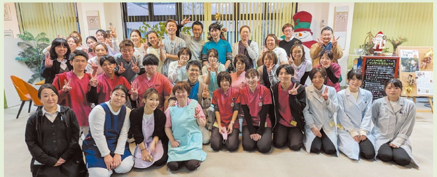
介護老人保健施設 八州苑 職員の皆さん