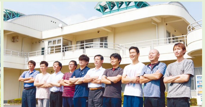
社会福祉法人 緑風会のスタッフの皆さん