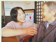
利用者支援の様子

今後も現状に満足することなく、本制度を活用し「輝く介護人材の育成」と「質の高いサービスの提供」に努めてまいります。