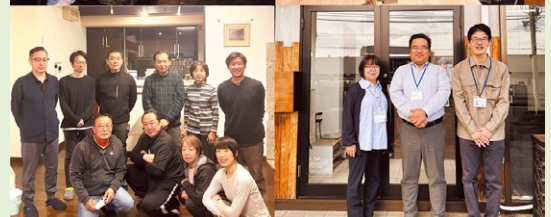
株式会社 照和のスタッフの皆さん