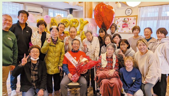
株式会社 花の器のスタッフの皆さん