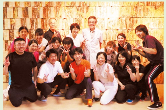
社会福祉法人 敬和会のスタッフの皆さん