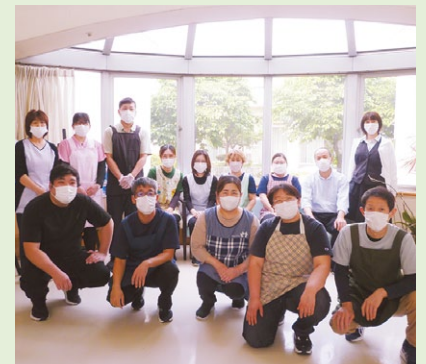
社会福祉法人 東風会のスタッフの皆さん

今後もこの認証に恥じないように、職 員と共に働きやすく、居心地がよく 安心して過ごせる施設づくりに、継続的 に取り組んでいきます。